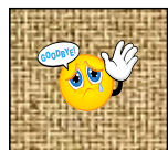
土に酸素がなく、呼吸ができない

酸素は発芽に絶対に欠かせない条件のひとつです。べたべたしたような土ではタネを粘土の中に埋め込んでいるようなものです。土の中に酸素のたまる隙間もなくしてタネが呼吸できません。細かくした腐葉土をべたべた土に混ぜてやわらかな通気性の良い土にしてからまきましょ。